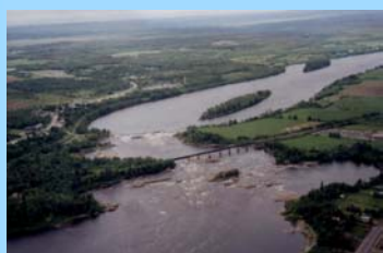
Chutes à Michel (2)

Ashuapmushuan : mot innu signifiant « endroit d'où l'on guette l'original »