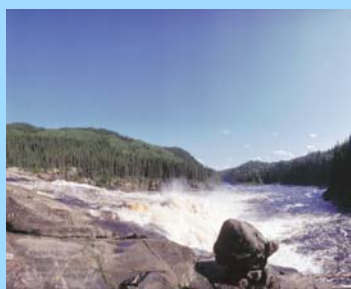
Chutes de la Chaudière (1)