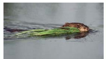
Rat musqué (4)