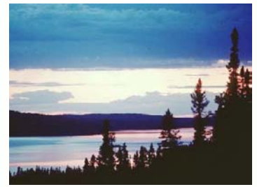
Rivière Ashuapmushuan (3)

La Loi sur la conservation du patrimoine naturel , adoptée par le gouvernement le 18 décembre dernier, prévoit la tenue d'audiences publiques sur les réserves aquatiques projetées afin de recueillir les commentaires des personnes, des organismes et des sociétés relativement au plan de conservation à adopter, et ce, avant le dépôt final du plan de conservation.